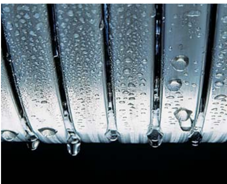
Suprafețe de transfer termic Inox-Radial