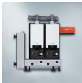
Ramă de montaj în cascadă (în linie)

Vitodens 200-W este un cazan mural cu funcționare pe combustibil gazos, cu design compact și elegant, ce oferă un raport ideal preț/performanță și este confortabil în ceea ce privește încălzirea și prepararea apei calde menajere.