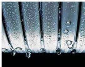
Suprafețele de transfer termic Inox-Radial - fiabile și eficiente

Cazanul în condensatie pe combustibil gazos Vitodens 111-W reprezintă soluția ideală pentru case unifamiliale. Datorită construcției compacte, acesta se potrivește fără probleme într-o nișă din bucătărie, hol, uscătorie sau oricare altă anexa a locuinței. Modelul Vitodens 111-W este disponibil cu puteri de 19, 26 și 35 kW. Cazanul oferă o performanță sporită la prepararea apei calde menajere, datorită combinației dintre acumulatorul de 46 litri din oțel inoxidabil și schimbătorul de căldură în plăci.