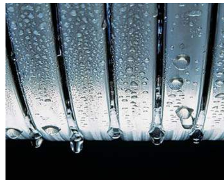
Suprafețe de transfer termic Inox-Radial

Cazanul Vitodens 222-W este un produs ideal pentru instalarea în clădiri noi datorită programului de uscare a șapei de care dispune.